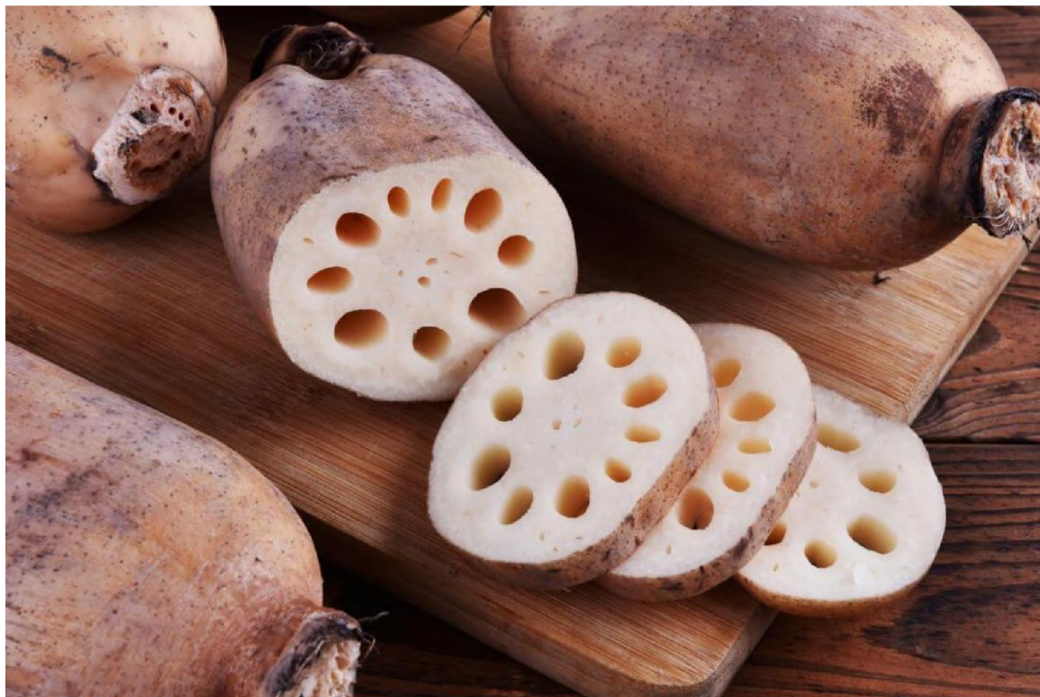
ภาพประกอบการทำข้าวเกรียบรากบัว